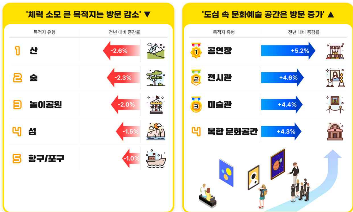
[’24년 대비 ’25년 방문 증감 주요 목적지 유형]

*데이터 출처: 한국관광 데이터랩, 이동통신 데이터(KT), 2024-2025년 연간 집계 기준 방문 비중 상위 30개 유형 중