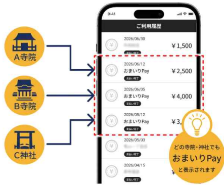
결제내역은 특정 사찰명이 아닌 '오마이리Pay' 로만 표시