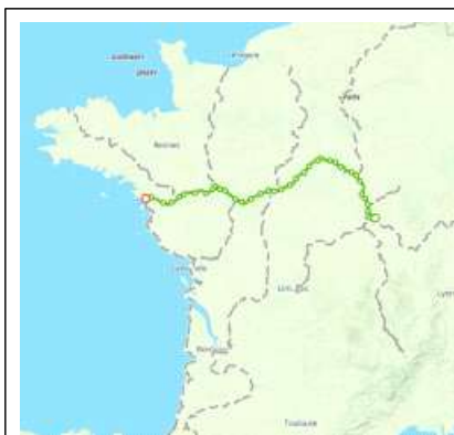
루아르 아 벨로(Loire à Vélo)