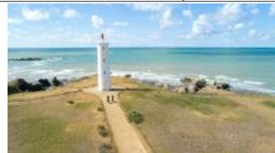
대서양 연안의 등대