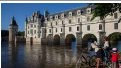
슈농소 성(Château de Chenonceau)